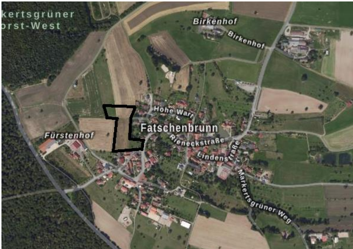
Abbildung 3: Lage der zu überplanenden Flächen (ohne Maßstab)

Der Gemeindeteil Fatschenbrunn der Gemeinde Oberaurach liegt im Regierungsbezirk Unterfranken, Landkreis Haßberge. Dieser gehört zur Planungsregion 3 „Main-Rhön“. Das Planungsgebiet liegt ca. 600 m nord-östlich des Ortszentrums.